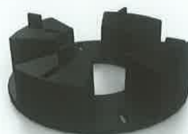
TL2 Terra Level Block 3 cm (stapelbar)

Terra Level Plattenlager 1 cm können auf jede beliebige Dichtfolie verlegt werden. Der sehr strapazierfähige Spezialkunststoff härtet nicht aus und reduziert den Trittschall. Terra Level Plattenlager sind stapelbar und können bei Aufbauhöhen von 1 cm bis über 20 cm eingesetzt werden.