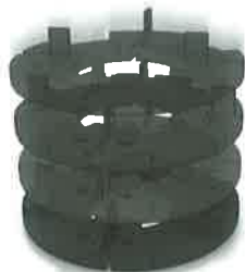
1 – 4 cm