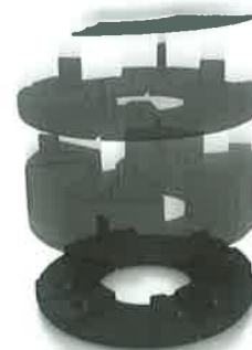
ab 5 cm