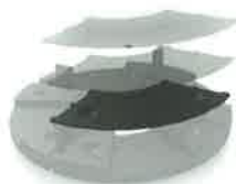
ab 1 cm